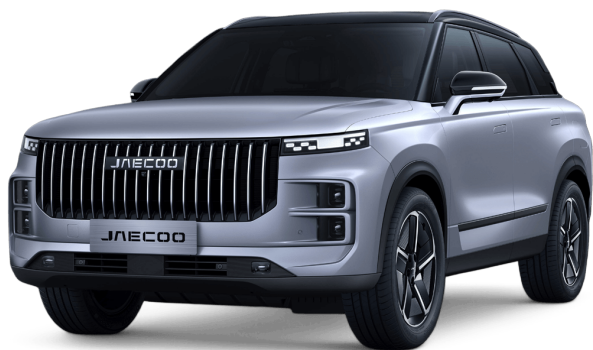
Uhlíkově krystalická černá a Měsíční stříbrná 20 000 Kč