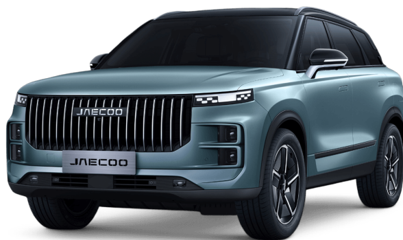
Uhlíkově krystalická černá a Olivově šedá 20 000 Kč