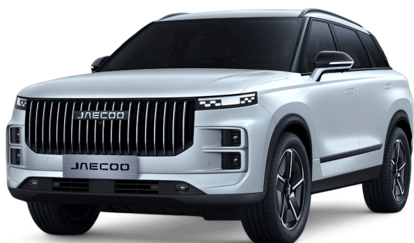
Khaki bílá 0 Kč