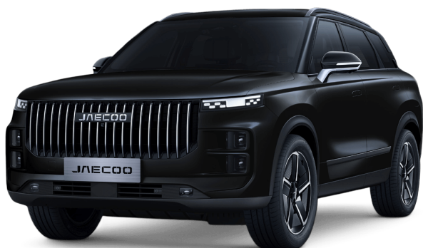
Uhlíkově krystalická černá 15 000 Kč