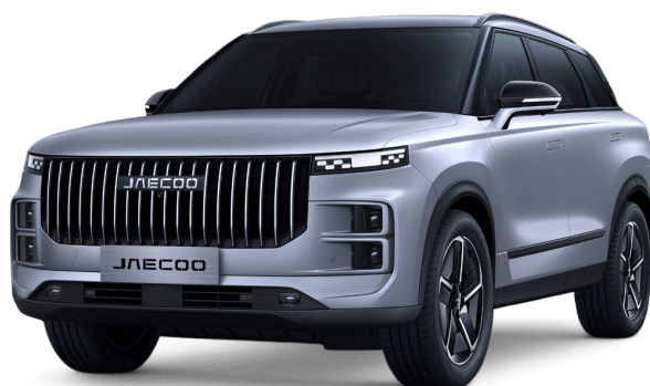
Měsíční stříbrná 15 000 Kč