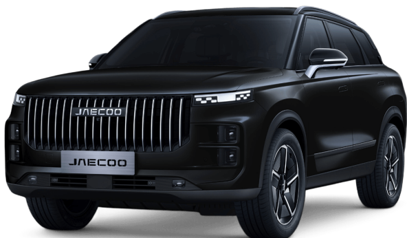
Uhlíkově krystalická černá 15 000 Kč